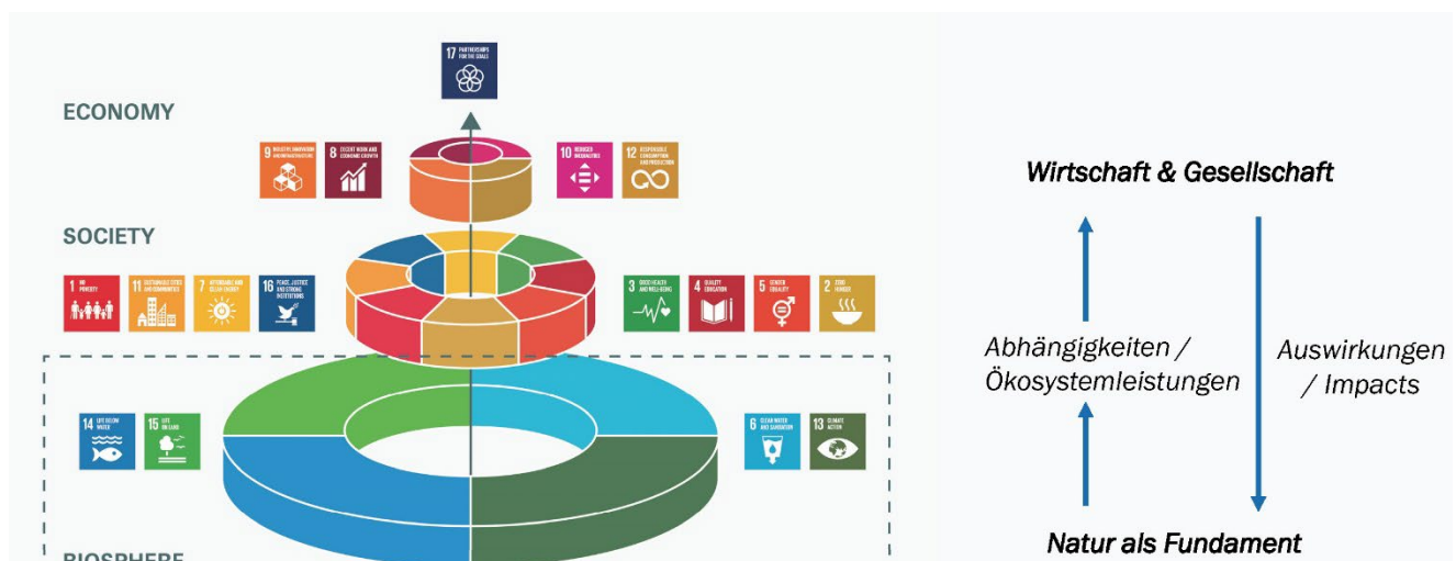
Abb. 1: Die Natur als Fundament (nach Rockström/Sukhdev 2016)

So zeigen erste Untersuchungen im Rahmen von Bio-Mo-D, dass die Flächen- und Zustandsbilanzen der staatlichen Ökosystemgesamtrechnung für die Unternehmensberichterstattung nach der neuen EU-Richtlinie CSRD nutzbar sind. Insbesondere bei der Analyse, ob an Unternehmensstandorten in Deutschland wesentliche Auswirkungen auf Biodiversität und